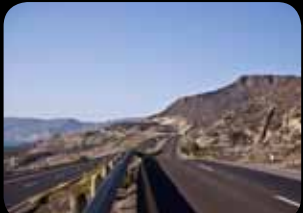
Highway 1 (California)