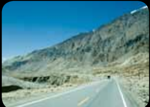
Karakoram Highway (China)