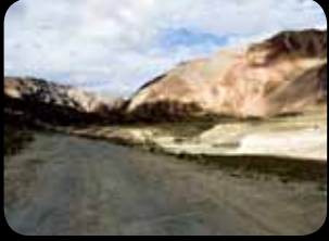
Khardung Pass (India)