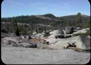
Rubicon Trail (California)