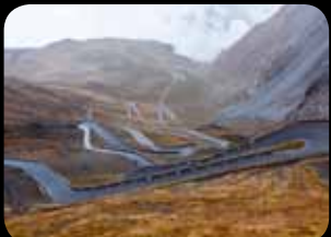
Stelvio Pass (Italy)