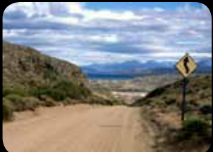
Ruta 40 (Argentina)